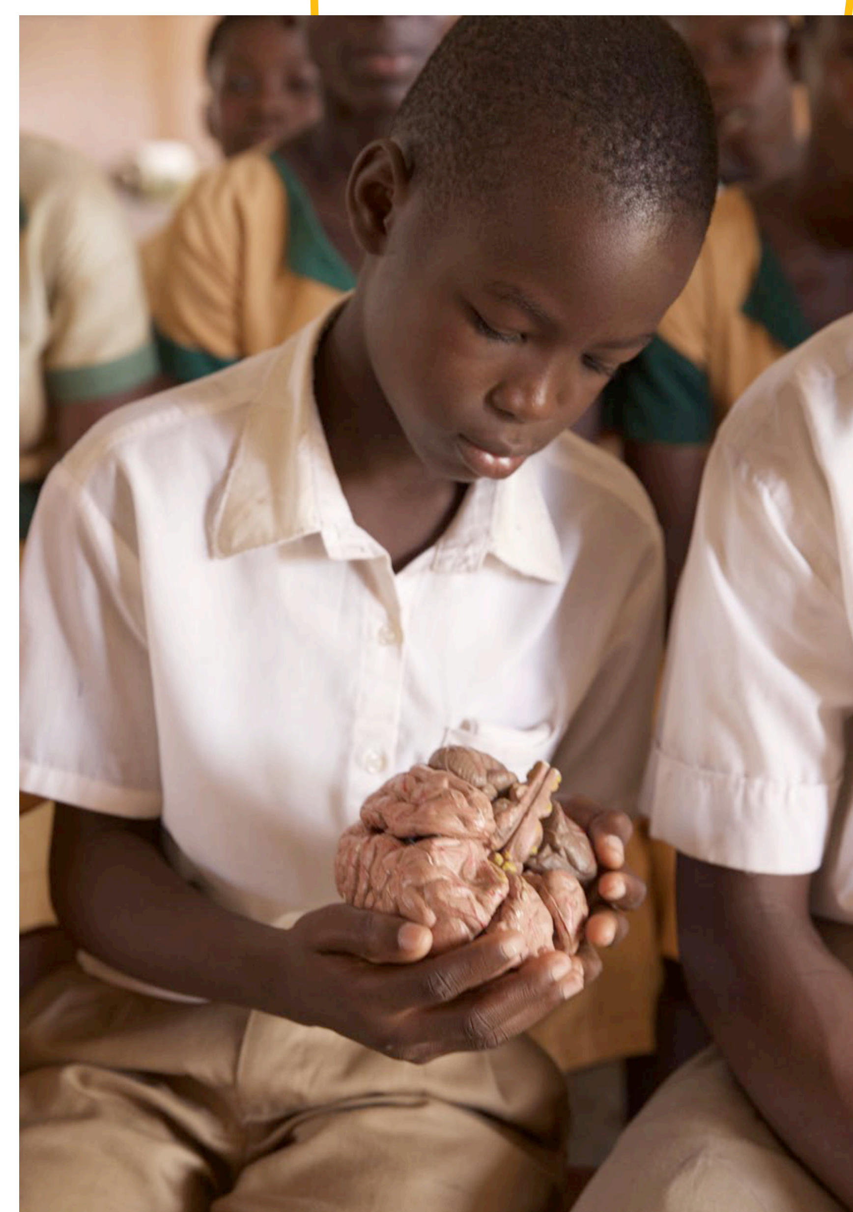
The brain - you are in charge of it!