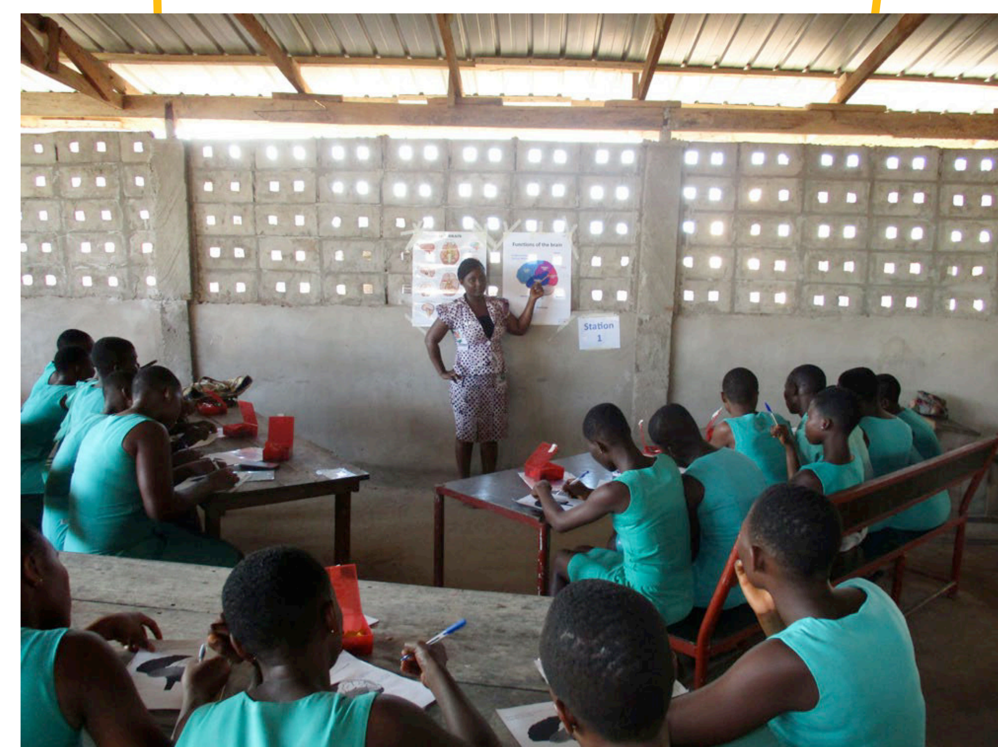
Eine Mitarbeiterin des Ketu South District Hospital übernimmt das Unterrichten.