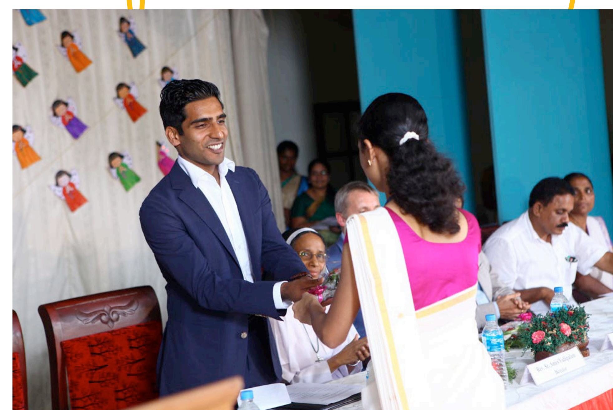
Feierliche Eröffnung des Stipendienprogramms am San Joe College of Nursing, Kerala.

Preisträger „weitergeben – Engagementpreis der Studienstiftung“ 2016