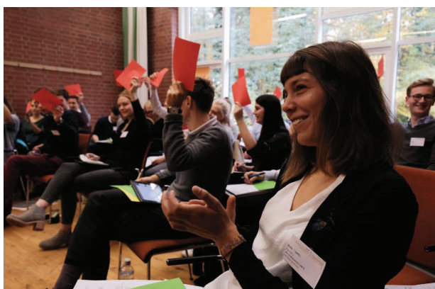
Zuspruch oder Ablehnung während der Plenarsitzung werden durch Applaudieren oder das Hochhalten von grünen oder roten Karten gezeigt

Wir freuen uns, wenn Sie uns Kontakte an Schulen, Hochschulen oder in die Politik vermitteln können oder an der Umsetzung einer Modell Bundestag-Veranstaltung interessiert sind. Zusätzlich befinden wir uns gerade in der Aufbauphase des Modell Parlament-Vereins. Auch hier können Sie uns durch Kontakte und Expertise im Bereich Vereinsrecht, Buchhaltung, Projektleitung und Marketing unterstützen.