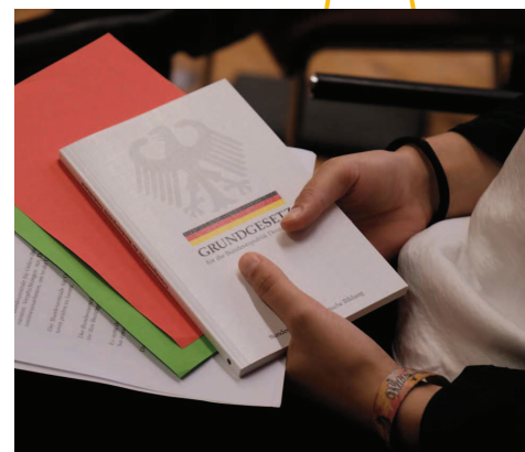
Für eine Plenarsitzung haben die Abgeordneten mehrere Unterlagen: den Gesetzentwurf, die Meinungskarten und das Grundgesetz

Starter- Preisträger weitergeben – Engagementpreise der Studienstiftung 2020