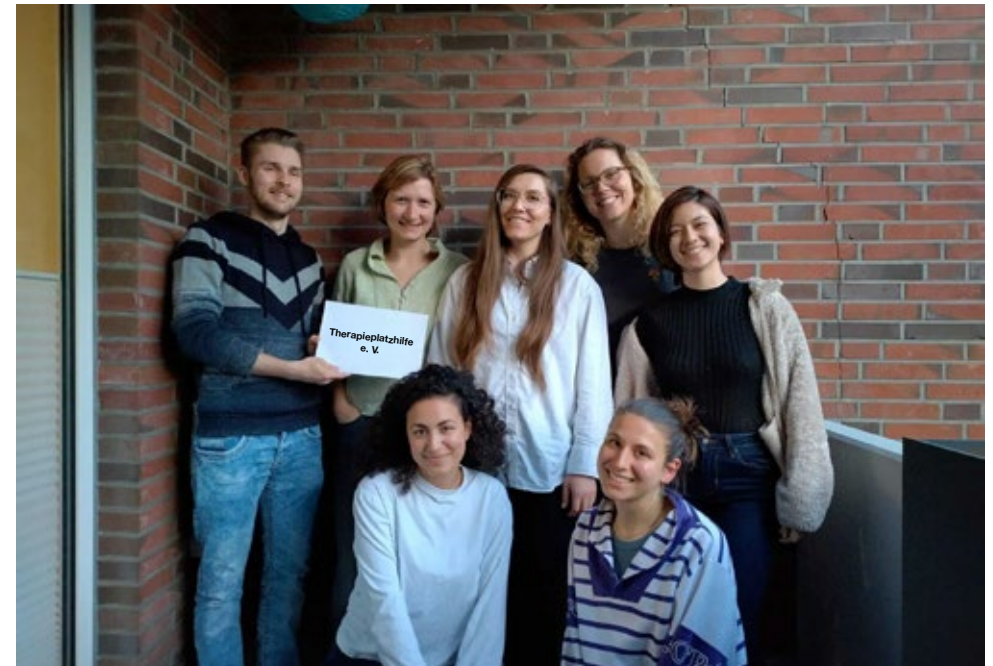
Gemeinsam gegründet: Das Team der Therapieplatzhilfe setzt sich für einen besseren Zugang zu psychotherapeutischer Versorgung ein.