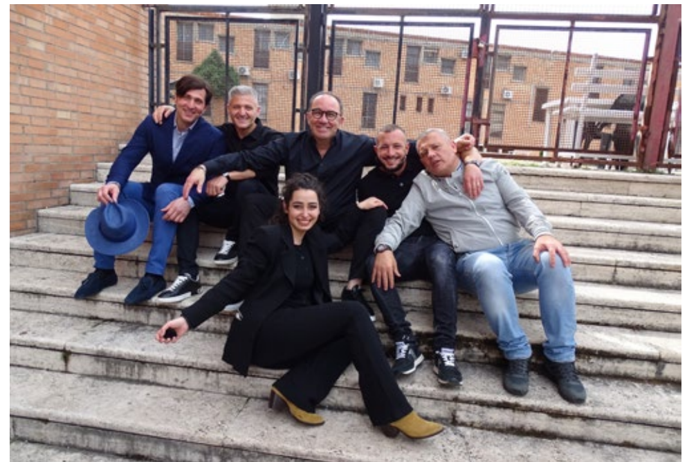
Im Austausch: Mitglieder eines Theaterprojekts im Gefängnis Rebibbia in Rom – Teil des Projekts „Metamorphosis“ – kurz vor einer Aufführung.