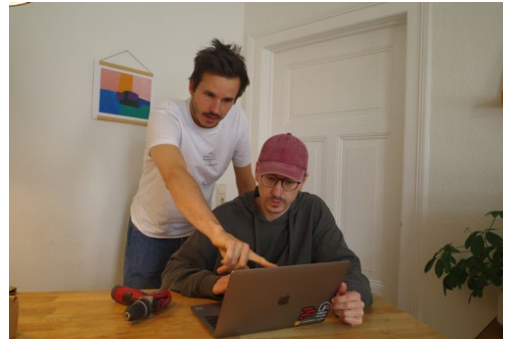
Gemeinsam entwickeln: Bei AllerLeih entstehen im Team konkrete Lösungen für das Teilen von Ressourcen.