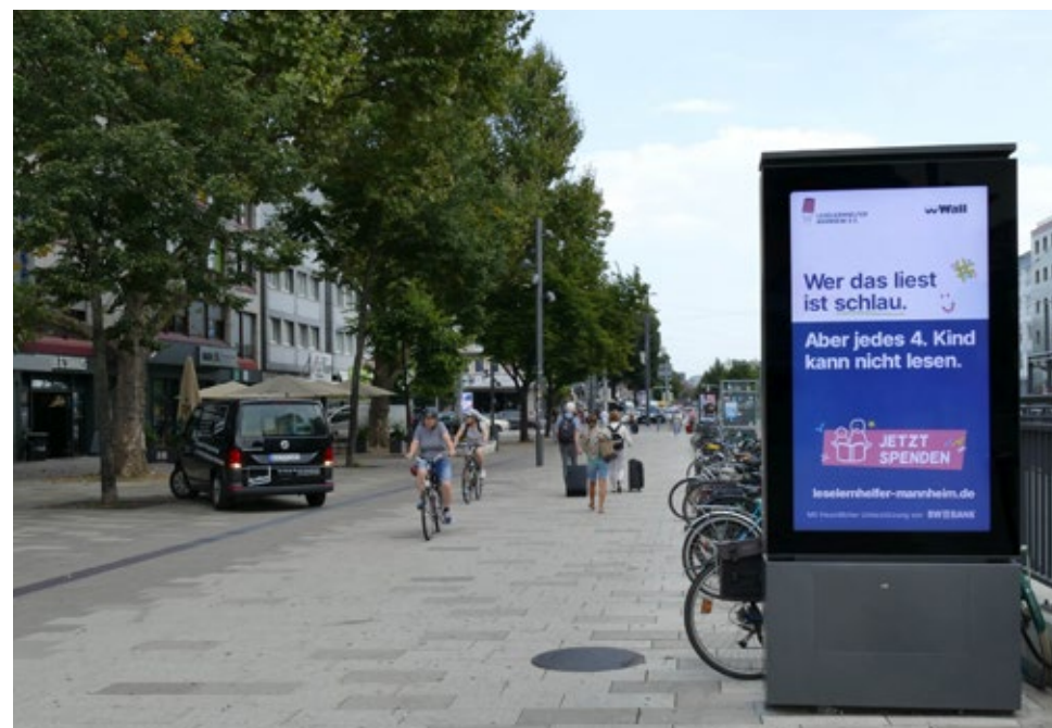
Sichtbar im Stadtbild: Eine digitale Kampagne in Mannheim macht auf fehlende Lesekompetenz bei Kindern aufmerksam und mobilisiert Unterstützung.