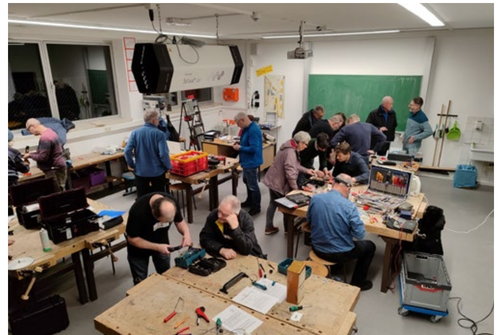
Gemeinsam reparieren: Im Projekt „Lappersdorf repariert“ werden defekte Geräte instandgesetzt und wieder nutzbar gemacht.