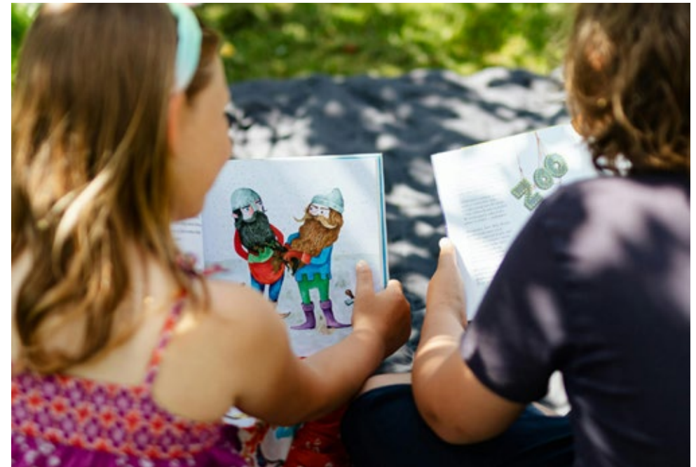
Raum für Nähe und Entlastung: Das Projekt unterstützt Familien in schweren Lebenssituationen. (Symbolbild)