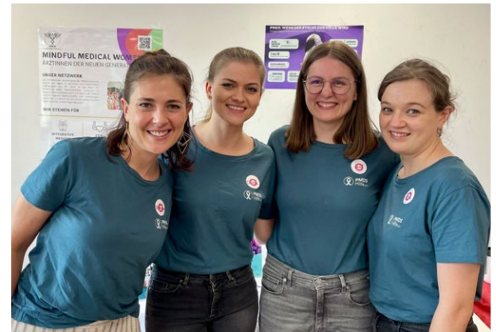
Gemeinsam engagiert: Der Vorstand von PMDS Hilfe e. V. setzt sich für Aufklärung, Austausch und bessere Versorgung ein