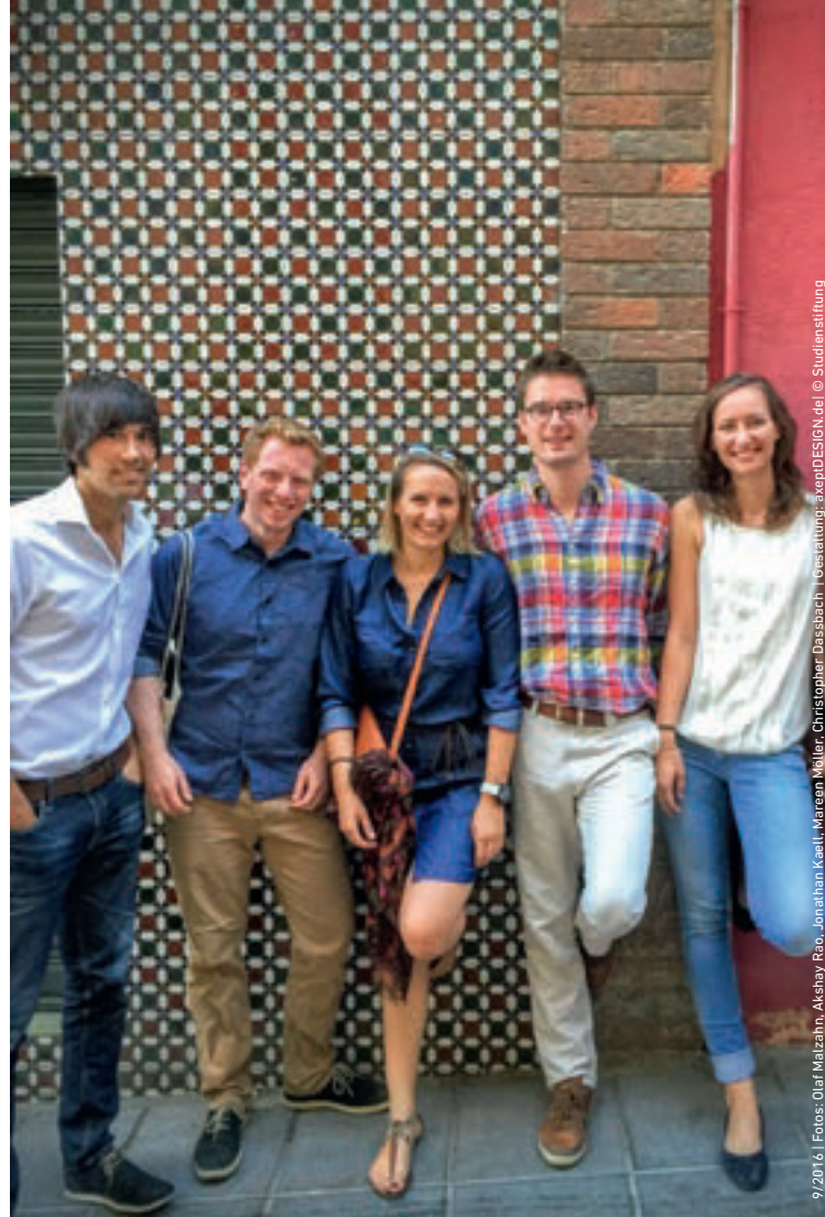
9/2016 | Fotos: Olof Malzahn, Akshay Rao, Jonathan Keel, Mareen Müller, Christopher Dasbach | Illustration: xkepDESIGN.de | © Studienstiftung